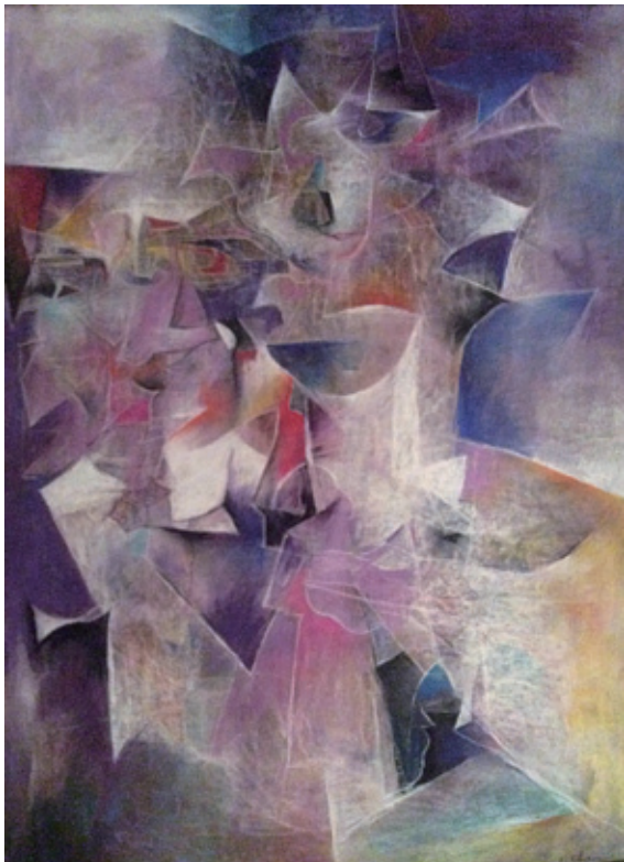
陳家榮 這是你的自畫像嗎？ 2008 粉彩畫紙 101.5×76cm

所以陳家榮多數作品是粉彩畫。但是超大畫作〈生之源〉，縱長900公分、橫寬600公分，以及橫向600公分、縱長152公分的大畫〈疾病與征服〉等，都是油畫，因為油畫獨有的顏料特性、厚重質性，能更顯現出格局萬千的恢弘大氣。大畫之外，他也有幾件尺寸為152×100公分等的中大型油畫。另外也嘗試過水彩畫及以複合媒材作畫，但現在可