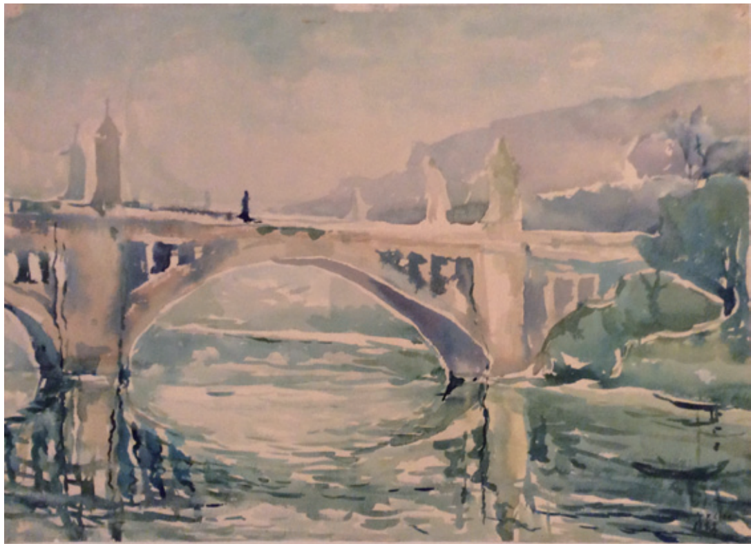
陳家榮 台北橋 1963 水彩畫紙 15.5×22cm

〈生之源〉成功地展示陳家榮對生命的禮讚。這是屬於他的「生命」系列創作的總結篇，是從一個懸壺濟世超過四十年的醫師的觀點，去詮釋人生活在世所經歷的生老病死，並以鮮活美麗的色彩繪出造物主創造天地的宏大景光，激發觀者以喜悅的心情去面對，更以尊嚴的態度在過完一生後如何追求永生。