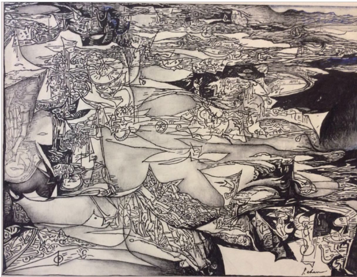
陳家榮 暴風 1985 鋼筆 46×61cm

家榮和我正式認識是在台大美術社。1958年，我從高雄女中考入台大外文系，家榮從台中一中保送台大醫科。我們家原有藝術淵源，二叔黃清埕是留日雕塑作品入選帝展的名雕塑家，三叔黃清溪取得日本醫學校的藥劑師專聘，一生卻以教小提琴為生，也做過高雄市交響樂團團長，並且他也舉行過畫展。父親雖沒有展示藝術天分，但寫得一手漂亮的毛筆字，且會吟詩，喜歡寫春聯。至於我們家姊妹六人，雖然喜歡聽故事，愛看小說勝於愛畫畫，卻都是班上的美術比賽的代表，負責壁報刊頭。所