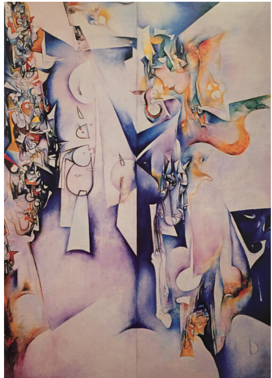
陳家榮 生之源（「生命」系列） 1988 油彩畫布 900×600cm（目前懸掛台大醫院大廳）

有動靜的畫面左邊，那一連串零零碎碎的小東西、派克人（PacMan）也都開始變成機器人似地活動起來。而整個畫面看來，正中央是一個巨人的形象，國王或皇后、普通人或上帝，他正面看你，或左右擺動，如果這個巨人提起一隻手，整個宇宙也會旋動起來。這就是陳家榮作品的特色。他利用古今中外各種畫風理論，遠近法、層次交錯法、古典寫實、或神祕浪漫、立體分割或超寫實手法，全熔於