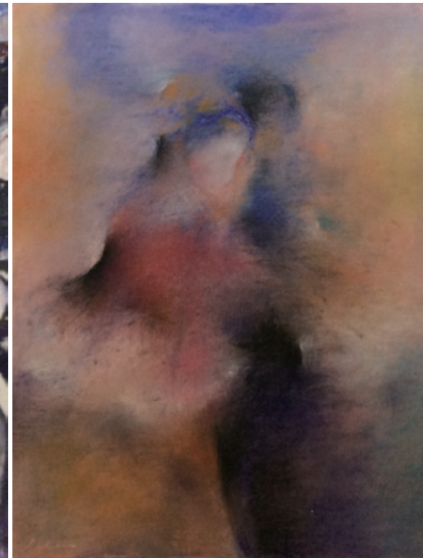
陳家榮 初舞 1984 粉彩畫紙 63.5×50cm

以當室友陳瑜懿看到台大美術社招募新會員時，馬上邀我一起去參加。我們剛到當年還存在的、靠近校門口的臨時教室去聚會，忽然間一群人推了一個小個子戴眼鏡的男生上台，不久宣布他是新會長。我正感覺有些莫名其妙，報名單就傳到我前面，有人催著我趕快填寫，原來那是那人答應當新會長的條件。我這下慘啦！不但每次畫維納斯的石膏像時，都沒機會自己完成，常被塗改成陳家榮的作品，而且要把石膏像抱回自己宿舍保管。