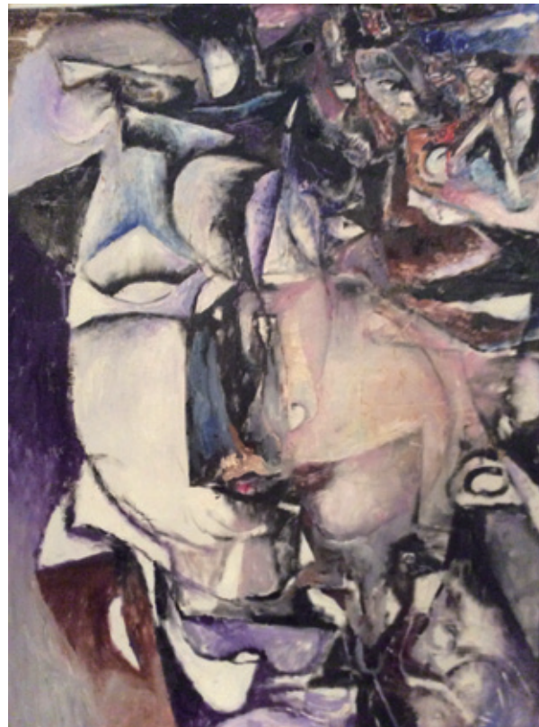
陳家榮 情人 1996 油彩畫布 127×94cm