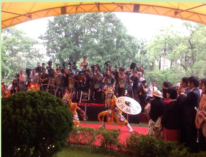
一千多名僑界人士把會場氣氛帶到最高點！