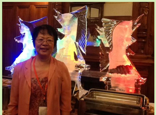
館內盛大的雞尾酒派對，僑委會歷屆主委均出席與僑民同歡。總統副總統也在立法