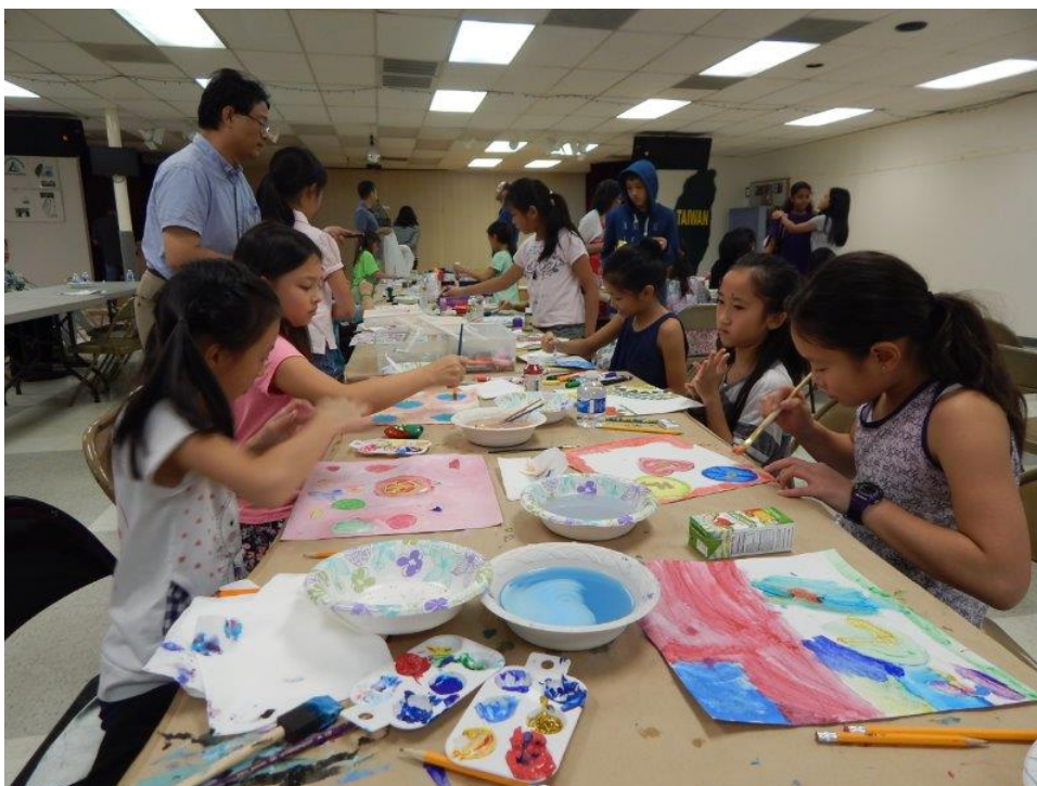
九月二十四日台灣語文學校的小朋友們在 Be the Peace - Be the Hope 活動中，發揮無限的創意，藉由畫畫為難民兒童加油打氣。 (活動圖片) (文章分享)