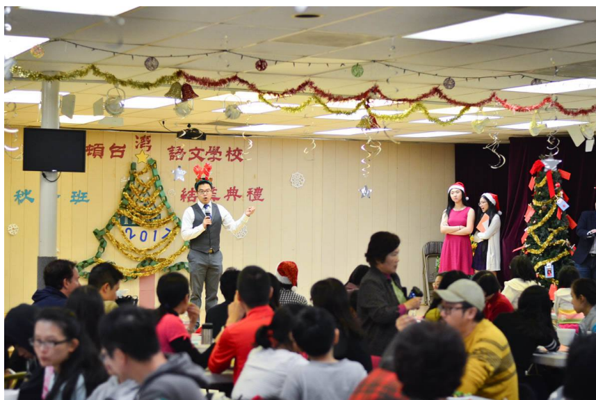
十二月十六日星期六，休士頓台灣語文學校舉行二〇一七年秋季班結業典禮。當天早上從十點半起就開始有一些展示台灣文化的活動，包括打彈珠、當場製作台灣傳統點心。午餐也是令人為之驚豔，有來自台灣道地的土魷魚羹、香辣的夫妻肺片、可愛的炸小薯球、以及好吃的點心等等，真的是非常用心。結業典禮時除了頒獎也有許多有趣的節目，當天大家都有吃有玩有聊，非常得開心。 (活動照片)