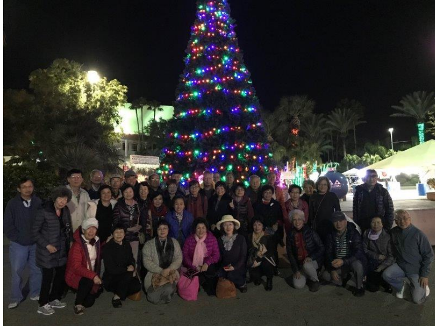
十二月十二日的一日遊，我們到Galveston, Moody Gardens去看 Festival of Lights。沿著Moody Gardens環繞一圈約一哩長。共約一百萬顆燈泡。並可遠眺Galveston Bay的景色。 (閱讀文章)