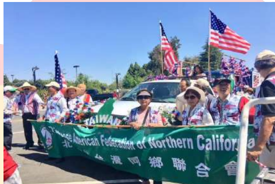
美國慶日花車大遊行@Fremont, CA