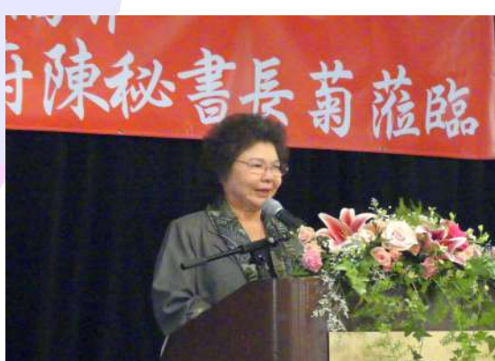
總統府秘書長陳菊來灣區訪問