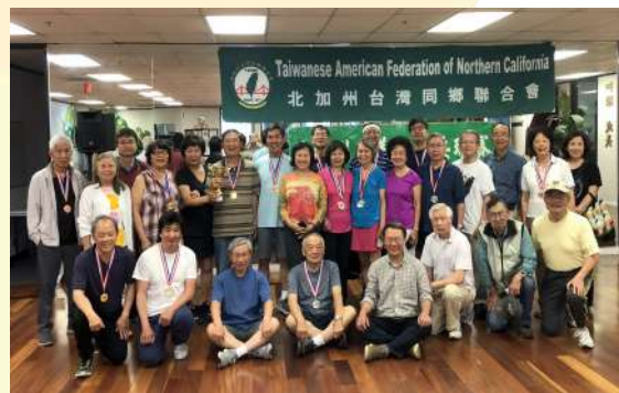
南榕杯台美人乒乓球賽