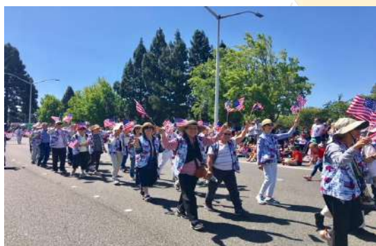
美國慶日花車大遊行@Fremont, CA