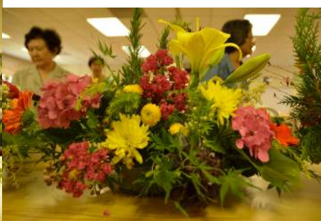
長樂會插花藝術班