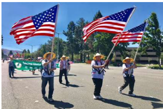
美國慶日花車大遊行@Fremont, CA