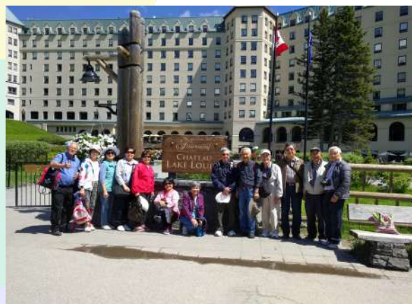
東灣同鄉參加 2018 美西台灣人夏令會