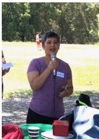
聯合會副會長致詞