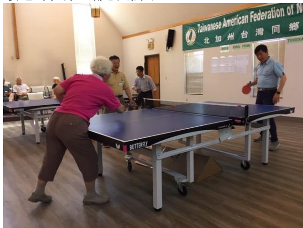
最老球員和馬處長拼了