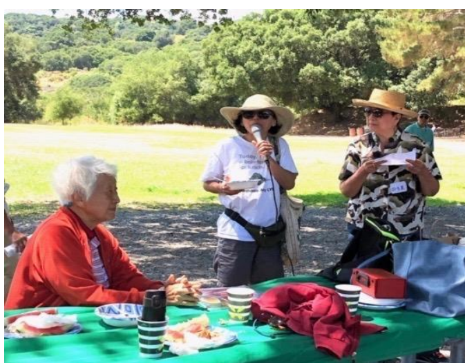
北加州婦女會長致詞