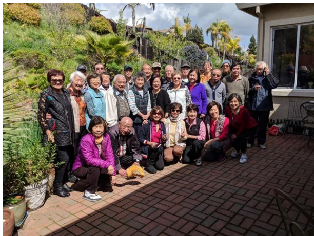
March 2019 in Antioch