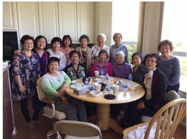
May 2019 in Walnut Creek