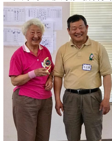
女單第二及最佳精神獎