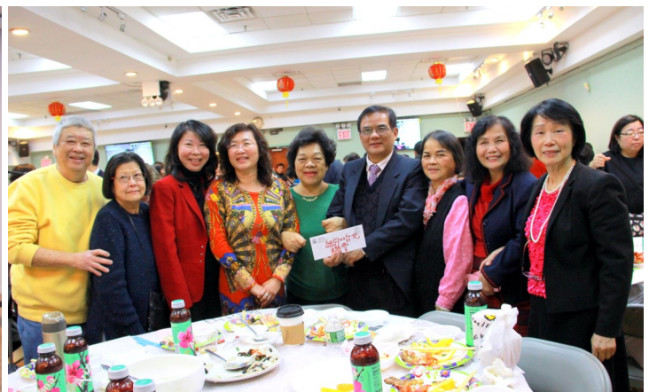
圖四 台灣會館老人中心成員抽中最大獎-中華航空公司台北-紐約來回機票，此獎由台灣會館提供。