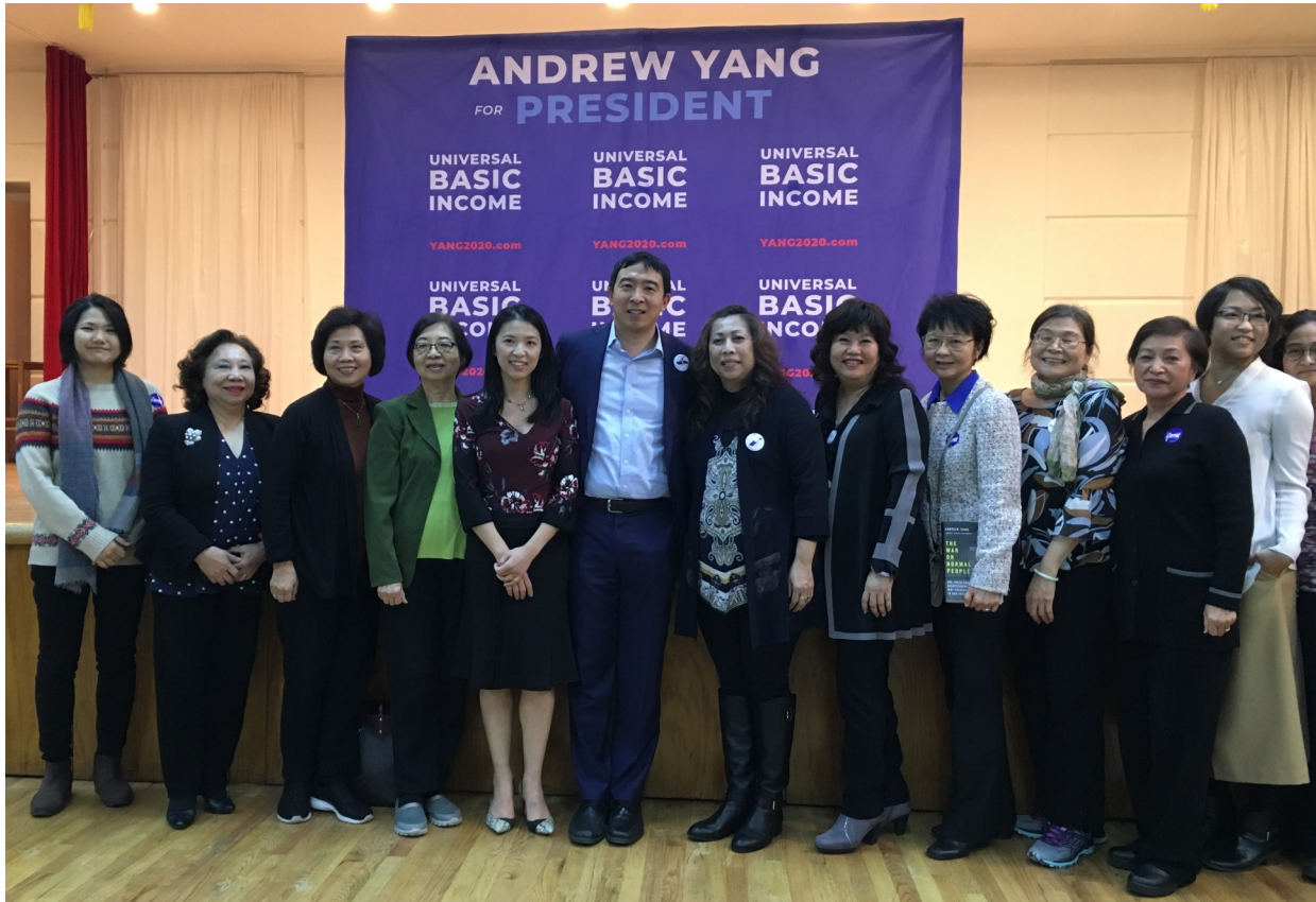
左至右: 連品文、台灣會館理事長方秀蓉、黃麗英、黃滿玉、王劭文、 楊安澤、蔡宜芳、林映君、林秀麗、鍾艾霖、黃玉桂、蔡璧徽

43 歲華裔企業家暨作者楊安澤(Andrew Yang) 於台灣會館舉辦政見交流會，讓法拉盛地區的民眾互相交流，了解他參選總統的原因以及政見等。楊安澤為首位華裔競選 2020 年民主黨籍總統參選人，他認為亞裔需要勇敢的站出來，表達自己的意見，展示自己，讓更多人了解我們。