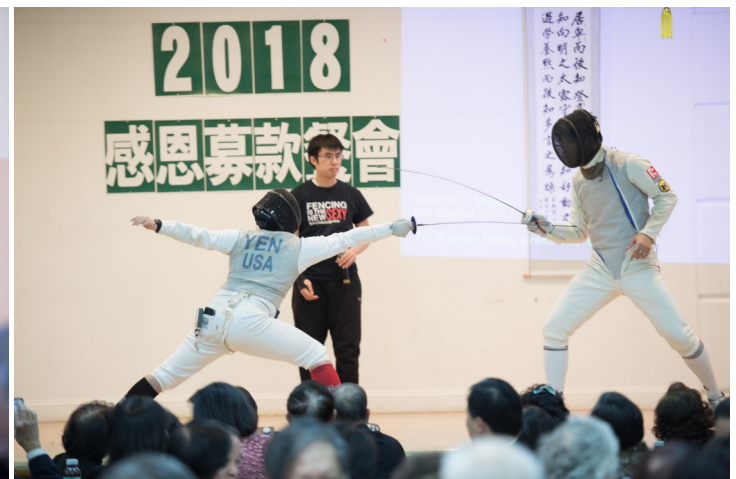
圖九 台灣會館西洋劍課展示