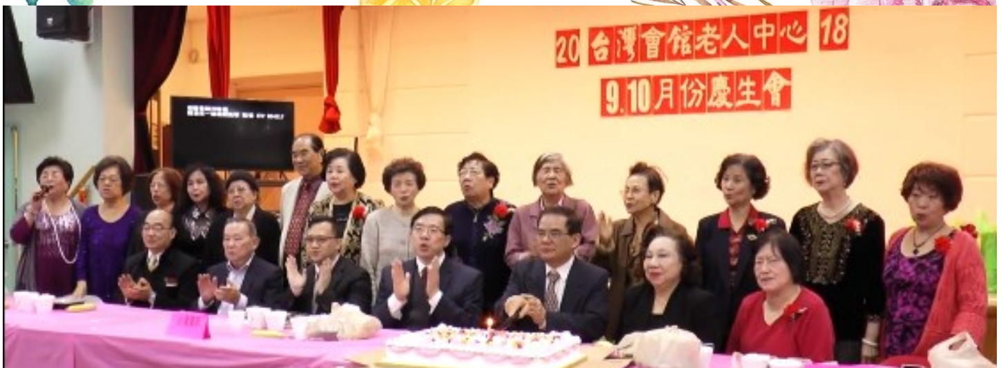
10 月 24 日台灣會館老人中心為 9、10 月份壽星舉行慶生會。