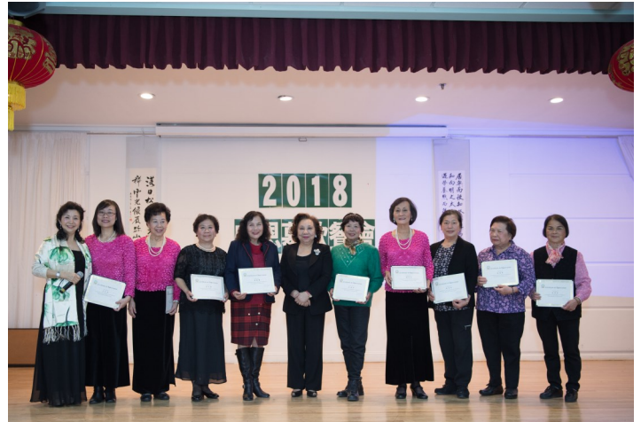
圖二 節目指導老師、志工們頒獎