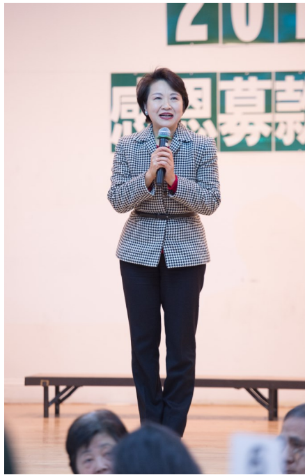
圖五 駐紐約台北經濟文化 辦事處 徐儷文大使