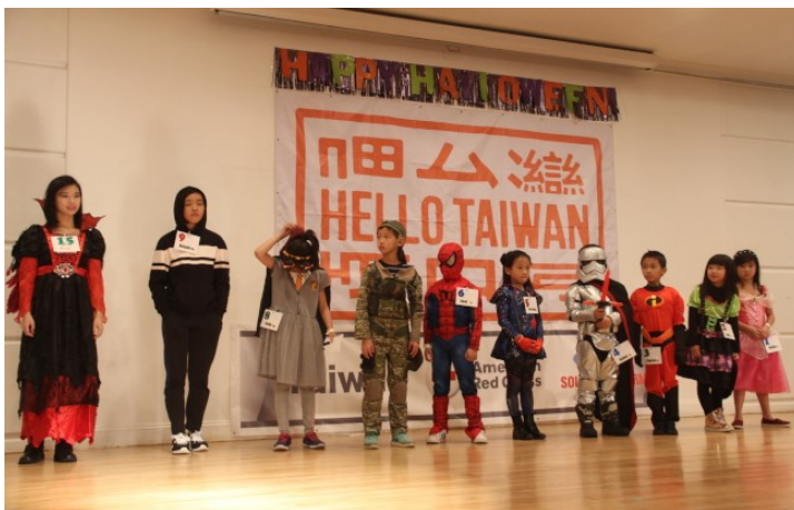
圖四 萬聖節服裝大賽