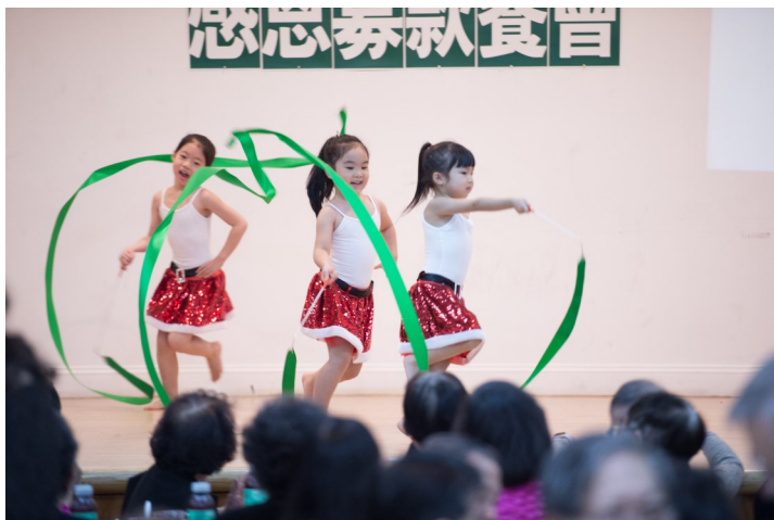
圖八 台灣會館兒童韻律操舞蹈班演出