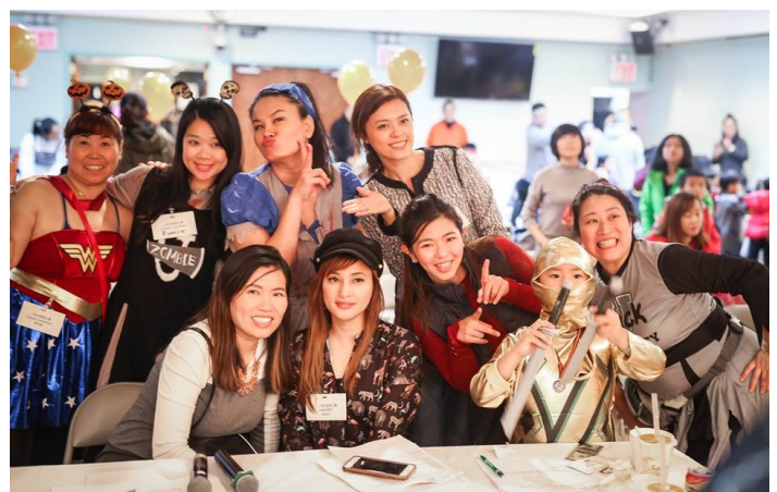
圖二 當天現場參與活動的民眾