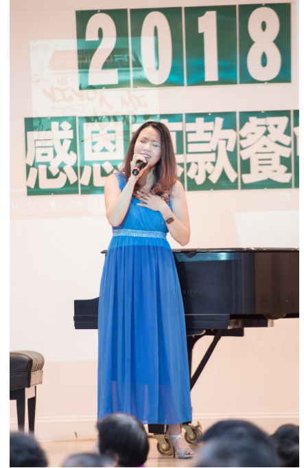
圖七 歌唱家李佳玲演唱