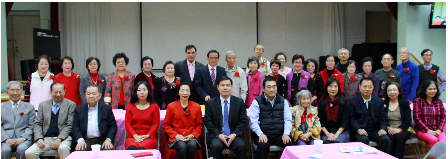
12 月 12 日台灣會館老人中心為 11、12 月份壽星舉行慶生會。