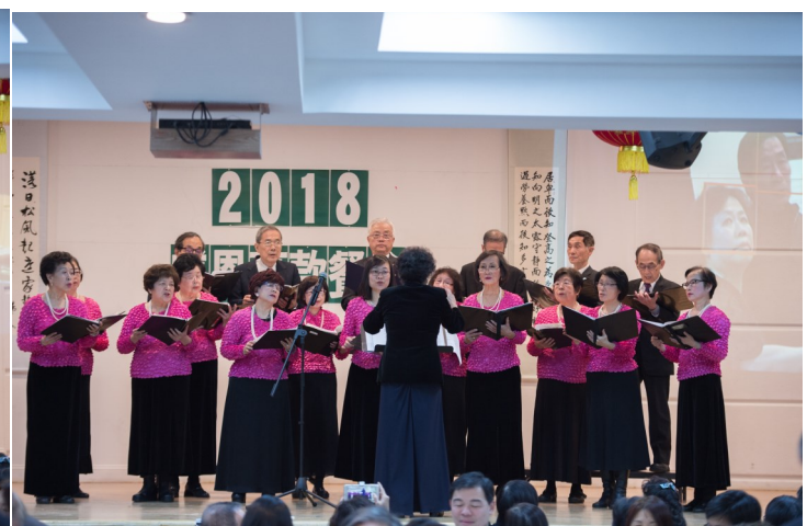
圖十一 台灣同鄉會合唱團