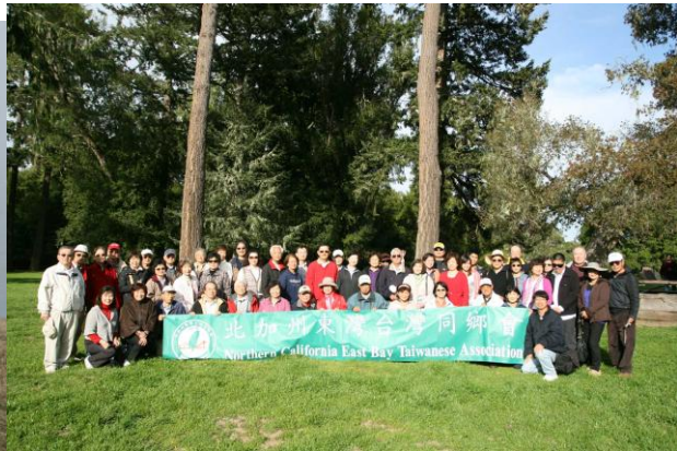
在舊金山4/18/1906發生的7.9級地震震央前合照