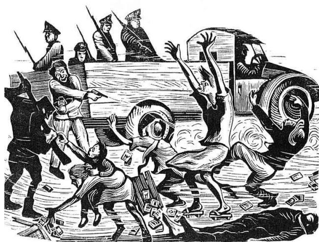
黃榮燦《恐怖的檢查——台灣二二八事件》1947年。

在這肅殺的氛圍之下，很多人連外出都不敢。富有正義感的黃榮燦，卻騎著腳踏車穿越大街小巷，因此曾有同伴懷疑他到底是不是「國特（國民黨特務）」？事實上，黃榮燦到處蒐集資料，詢問相關目擊者二二八事件經過。兩個月後，他秘密完成了《恐怖的檢查》木刻版畫。