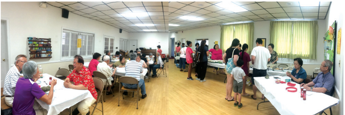
台灣小吃義賣現場