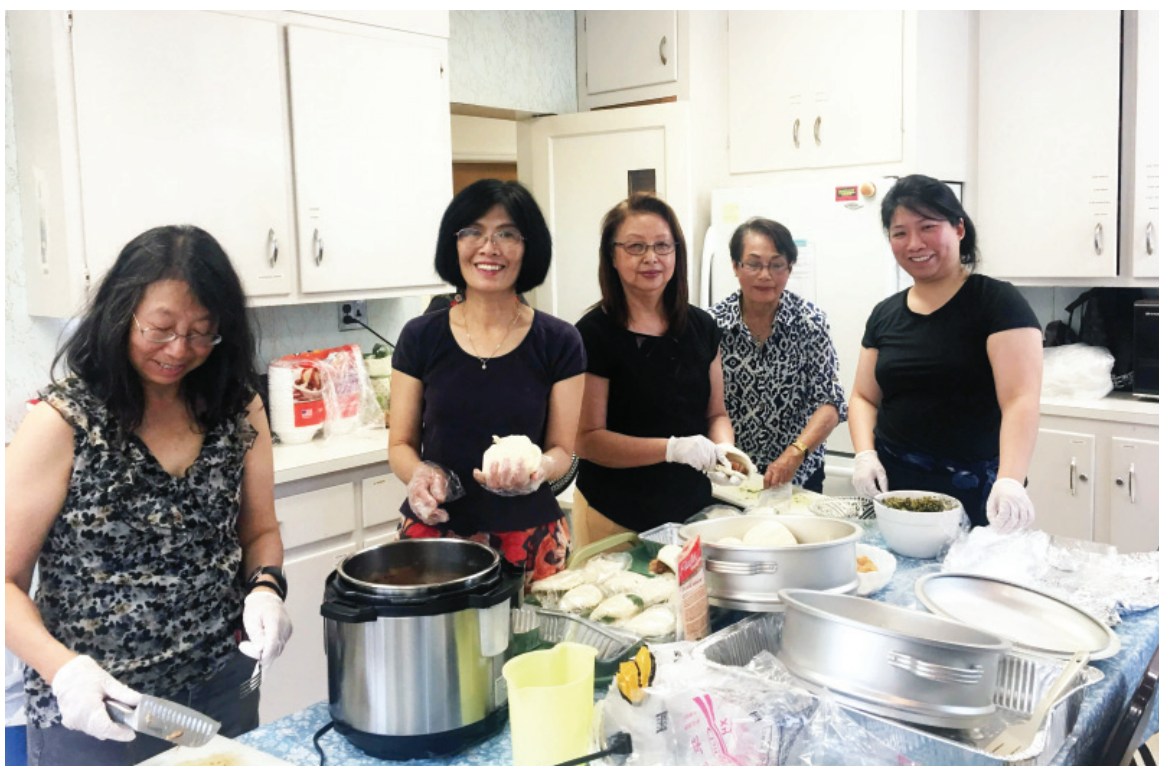
廚房裏忙碌的小吃製作團隊