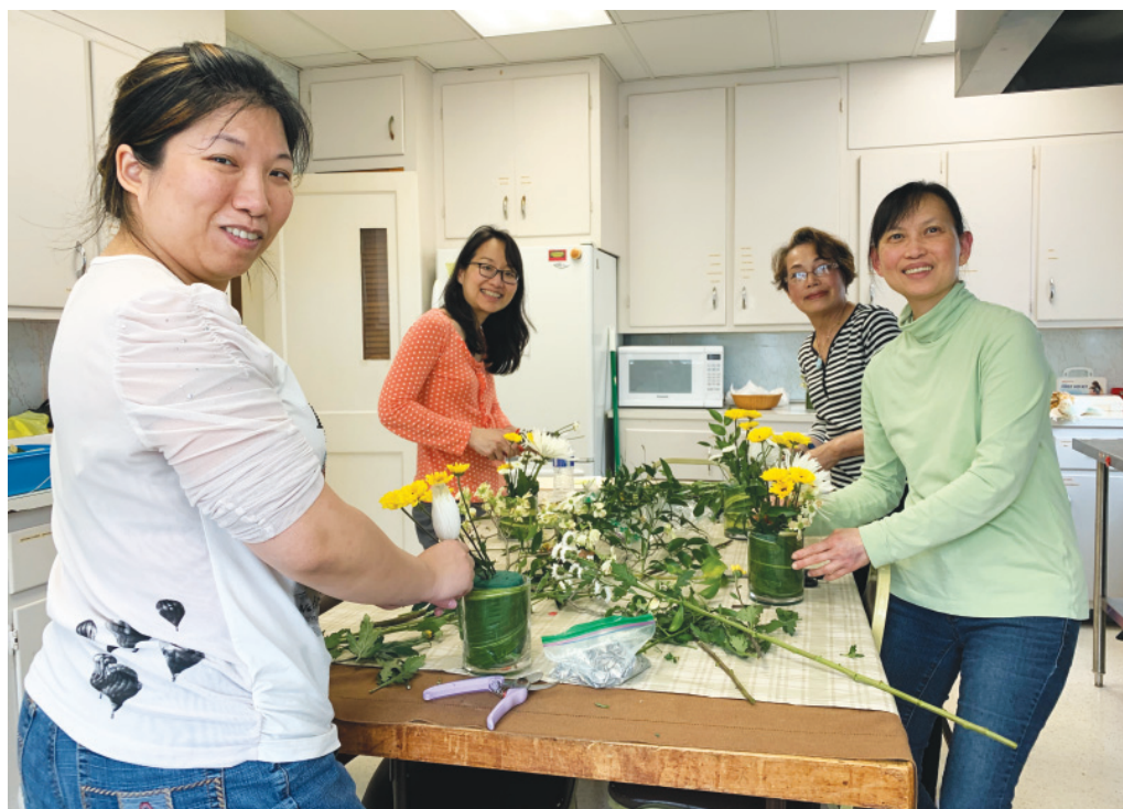
四位美女準備花材佈置教堂