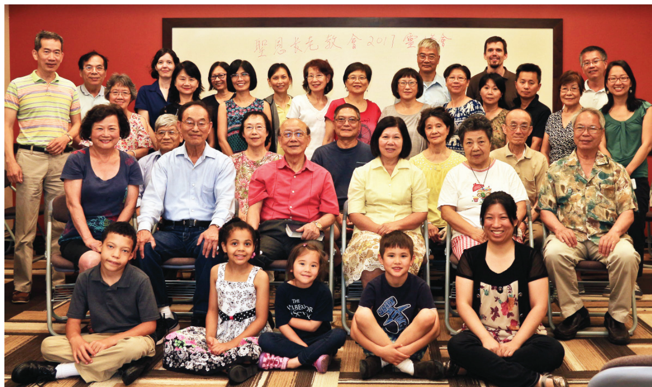
莊牧師牧師娘與聖恩會友攝於賓州使者農莊