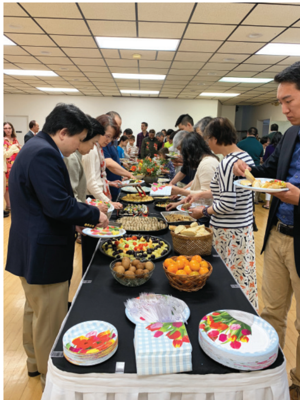
豐富的食物，溫馨的感恩禮拜