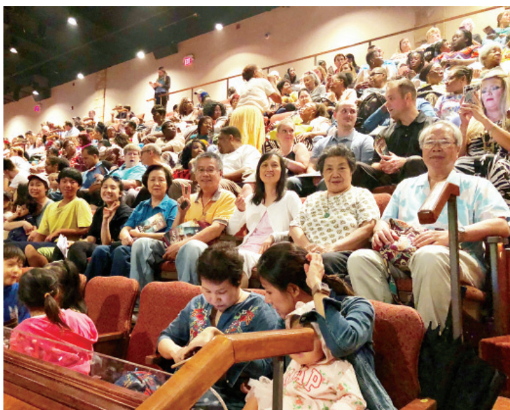
到 Lancaster 看舞台劇 "Jesus"