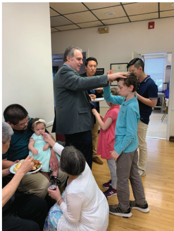
三代同堂，令人羨慕