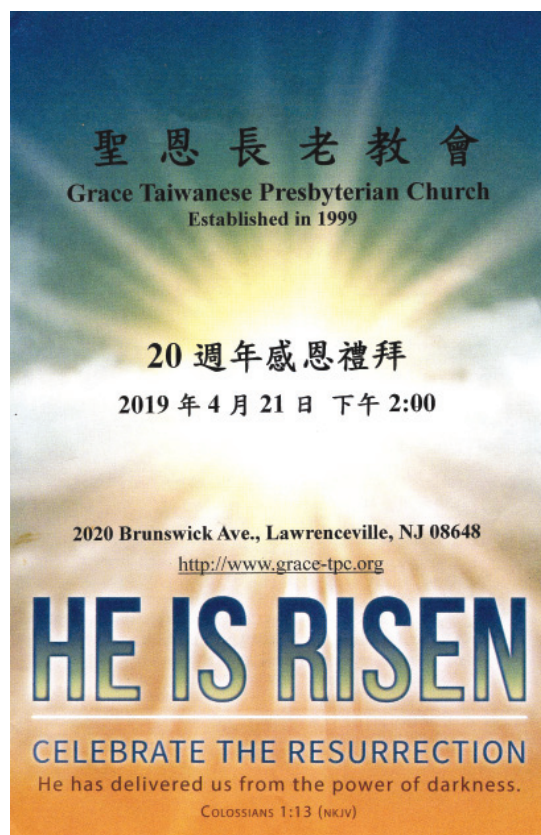
聖恩 20週年禮拜程序封面

We also have had countless preachers who helped us out during the periods when we did not have full time pastors. We thank them all for their