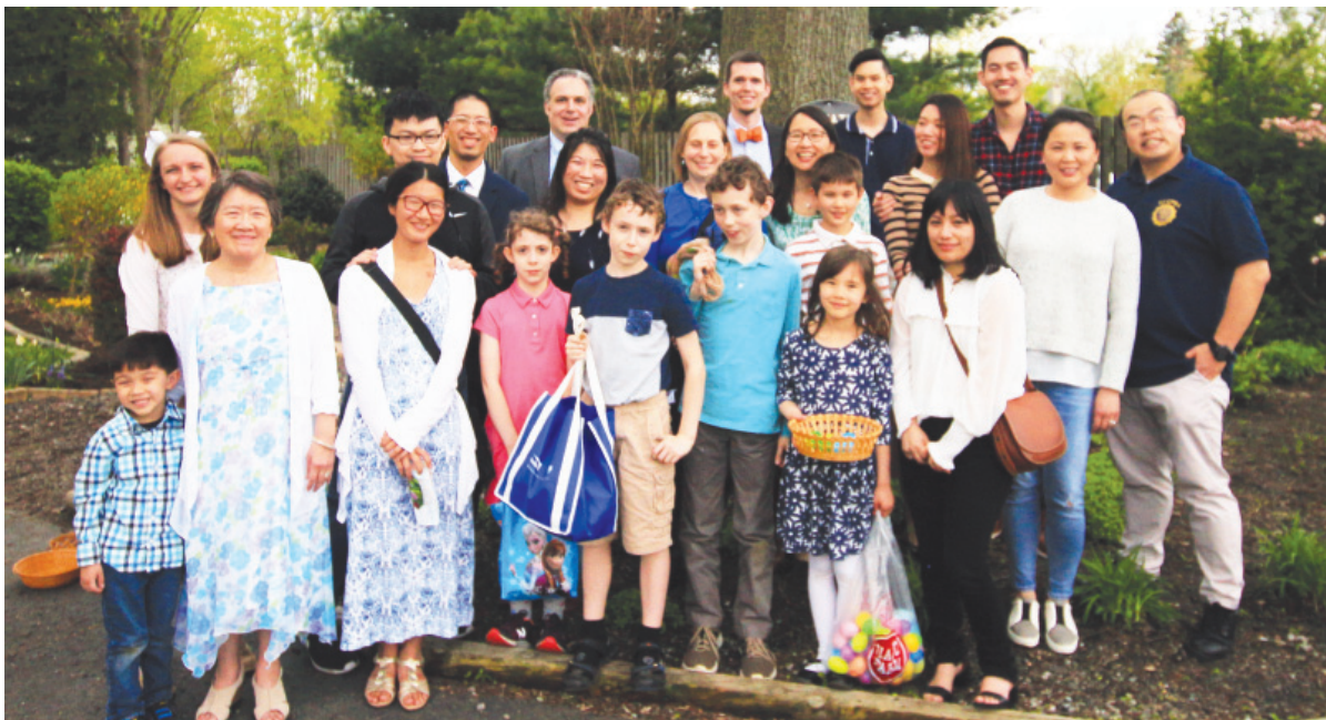
年輕會友攝於 Meditation Garden 前

一年前含淚送走長期臥病的丈夫，沒想到，現在含笑迎進活潑賢慧的洋媳婦。十多年來的代禱，上帝一直在聆聽；堅定不移的母愛，無止境的主恩，見證愛的力量。