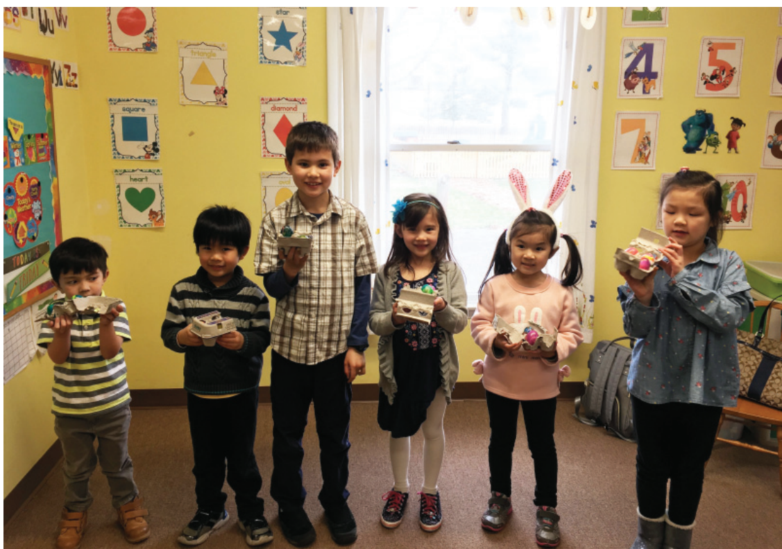
兒童主日學作品展