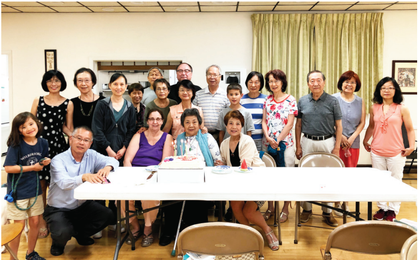
大家一起歡慶生日快樂

賀祝建教貳拾載 聖讚歌聲頌主愛 恩典豐滿袍白賜 長頌大恩榮耀主 老我已去慶重生 教會推展齊同心 會眾相愛喜樂融 二魚五餅人飽豐 十字寶架主救贖 年歲冠冕主所賜