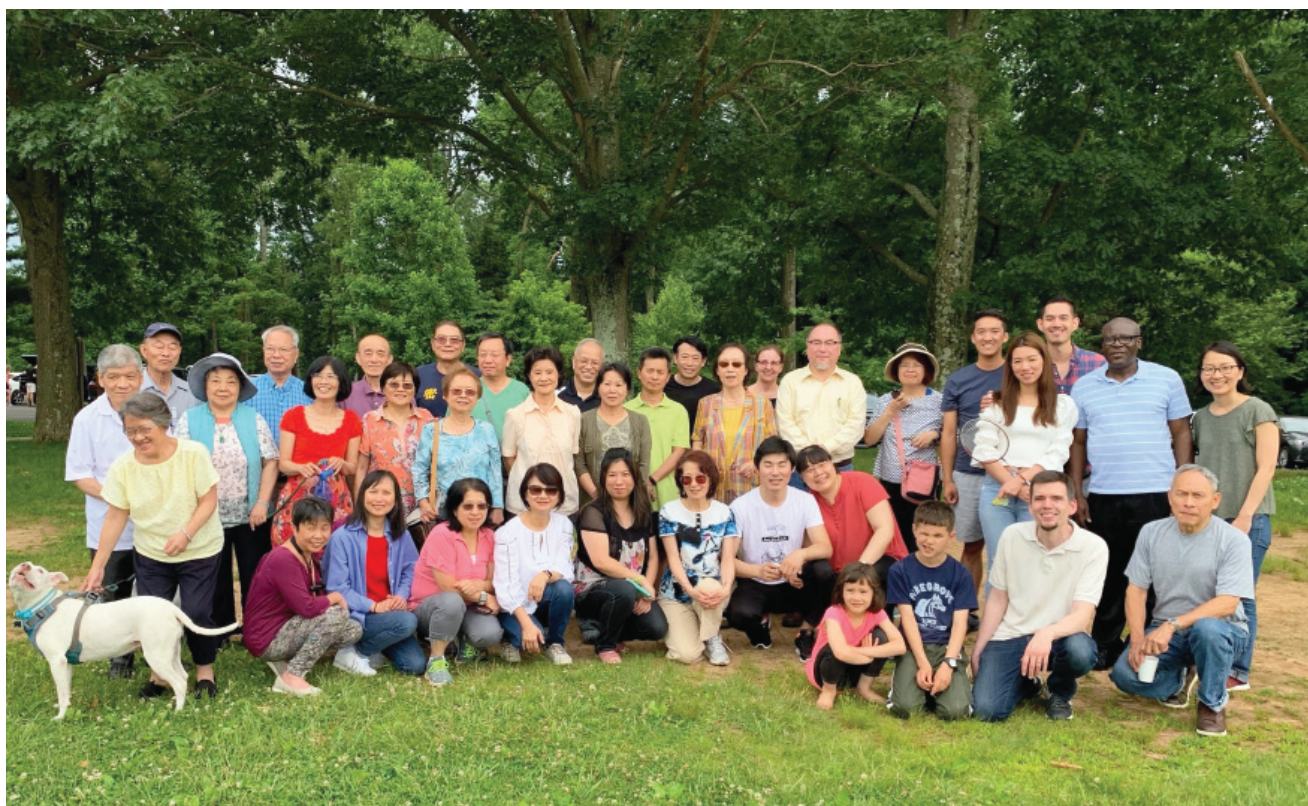
2019 父親節攝於賓州 Tyler State Park