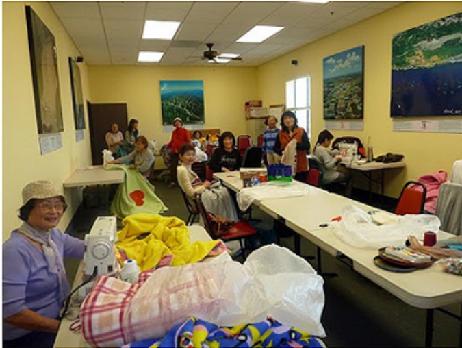
1) 車毯子 4/6/13