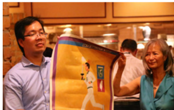
巧蓉自 FAPA 總部帶來由黃根深教授在 1987 年繪製「台灣民主聖火長跑」海報